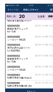
④ 担当者別の持ち出し工具リストの完成