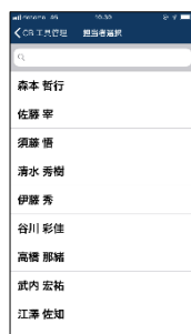
② 持ち出し担当者を指定 作業府ループや持ち出し先の 指定も可能