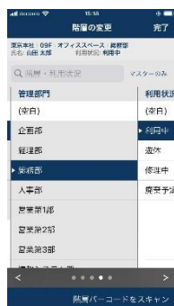
右図) 棚卸し担当者の自動設定イメージ (ログイン情報から担当者を自動設定)