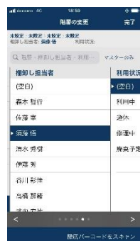
左図) 従来の棚卸し担当者指定イメージ (選択肢から指定)