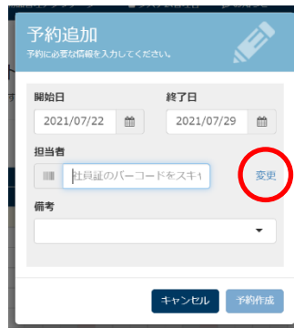
予約追加画面で担当者の「変更」をクリックすると代理予約が可能になります