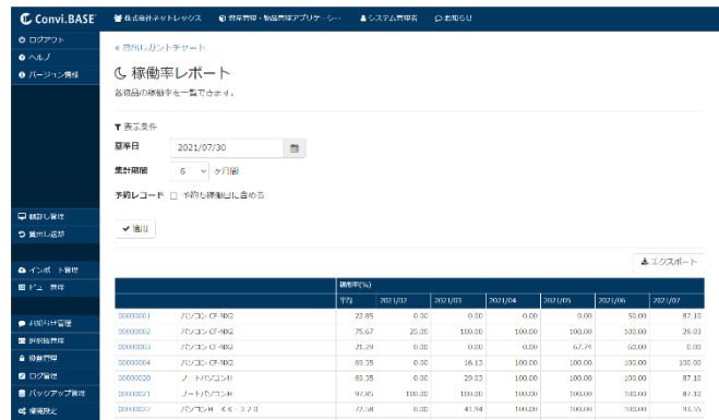
最大 12 か月分の稼働率を確認することが可能です